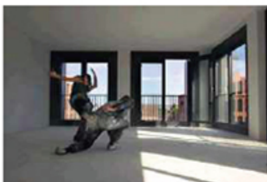
De dansers van de voorstelling 'thuis' houden zich niet aan een vooraf bepaalde choreografie, maar improviseren.

Spannend is ook de omgeving. Piazza Céramique zal binnen een paar maanden als een gelikt complex worden opgeleverd, maar is nu nog ruw en onafgewerkt. In de hal staan nog geen