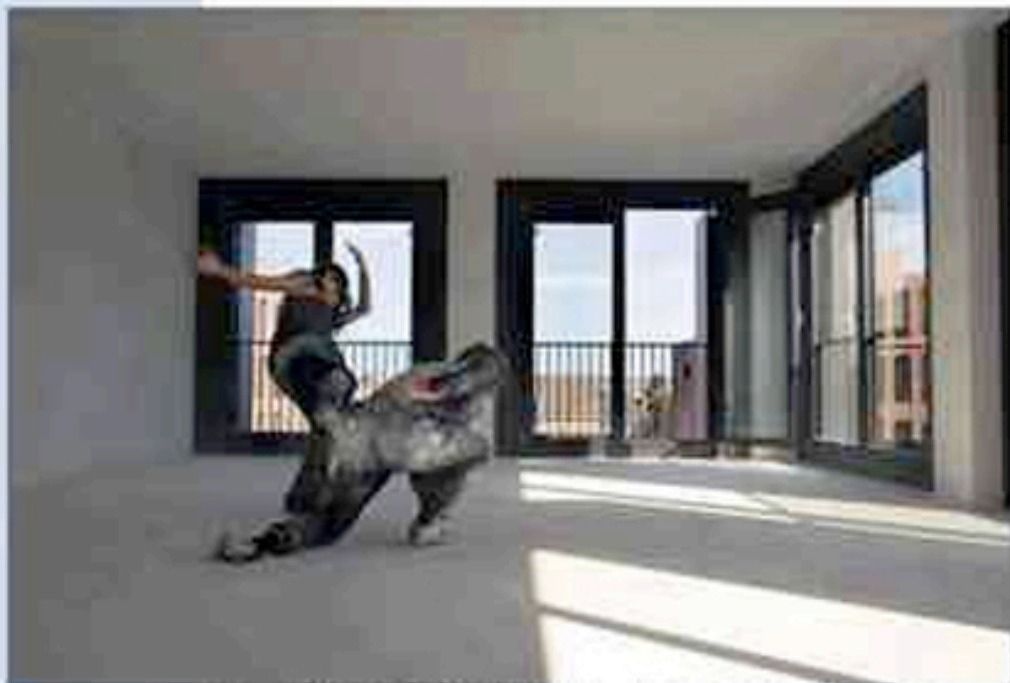
De danser van de voorstelling 'Wacht' (rechter) tijdens een voorproef van de voorstelling 'Wacht' (links) op de bouwstof en betonvloer.

W A C H T Een voorstelling in het domein van de voorstelling 'Wacht' (rechter) tijdens een voorproef van de voorstelling 'Wacht' (links) op de bouwstof en betonvloer.