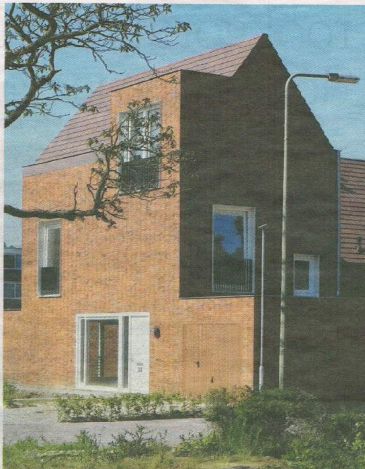
Jo Janssen/Wim van den Bergh: Treebeek , Brunssum