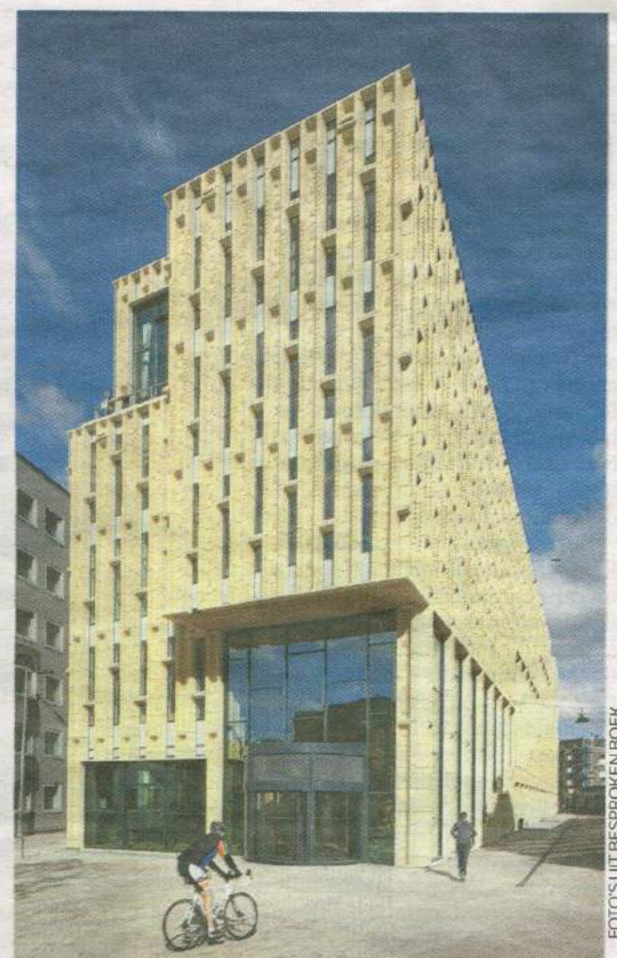
Neutelings/Riedijk: Rozet , Arnhem